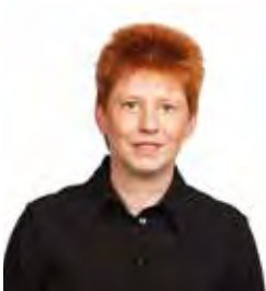
Petra Pau Marzahn-Hellersdorf Henny-Porten-Straße 10-12 12627 Berlin Tel.: 030/99289380 petra.pau@bundestag.de