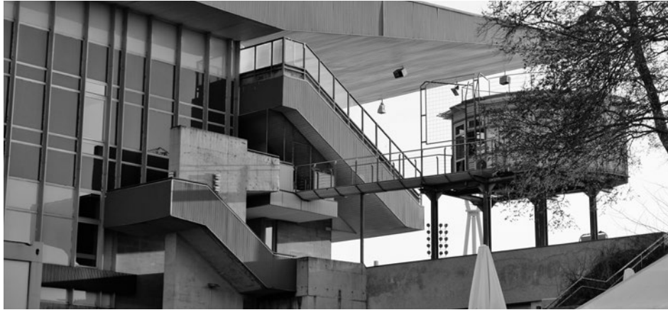
Das Jahnstadion: Mit seinem markanten Dach und den Flutlichtmasten

gehende Versiegelung des Grundstücks, eine Vervielfachung der Stellplätze für den privaten Kfz-Verkehr. Das ist Exklusion statt Inklusion.