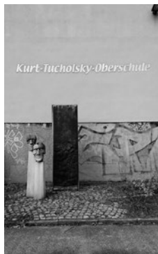
Kurt Tucholsky Oberschule in der Neumannstr. 9

Nach aktuellen Berechnungen stehen mindestens 1.200 Plätze bei Integrierten Sekundarschulen und ca. 1.700 Plätze bei Gymnasien auf dem Spiel und die Zahlen steigen weiter. Viele Bauvorplanungen