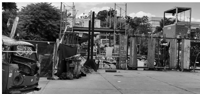
Grundschule am Planetarium und der ehemalige Güterbahnhof Greifswalder Straße mit seinen Zwischennutzungen

der Grünen, CDU, AfD und der FDP gekippt. Nun bleibt der Politik nur noch, in Gesprächen mit dem Eigentümer des Areals Schlimmeres zu verhindern. Insbesondere die Grünen glauben an dessen Zusicherungen, außer hochwertigem Wohnungsbau auch eine weiterführende Schule zu ermöglichen. LINKE und SPD wissen, dass es diesem Investor vor allem um seine Rendite geht. Sie haben deutlich gesagt, dass sie ihre Pflicht darin sehen, die Interessen des Bezirks und der Allgemeinheit zu verfolgen. Wie es ohne das geregelte Verfahren eines Bebauungsplanes weitergehen soll, wird sich ab Ende August zeigen.