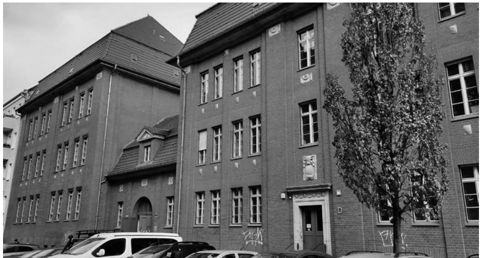
Felix-Mendelssohn-Bartholdy-Gymnasium in der Pasteurstr. 7

Wir brauchen dringend sogenannte Schuldrehscheiben, damit Schulgemeinschaften dorthin umziehen können, wäh-