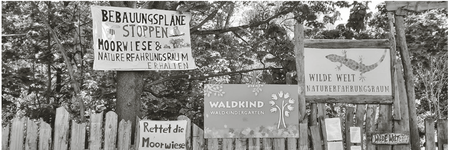
Der Abenteuerspielplatz Moorwiese am S-Bahnhof Buch

werte Feuchtbiotop Moorlinse heran. Ein von der Linksfraktion unterstützter Beschluss der Bezirksverordnetenversammlung (BVV) fordert nun, diese Blöcke, die auch der städtebauliche Entwurf nur als optional bezeichnete, ganz aus der Rah-