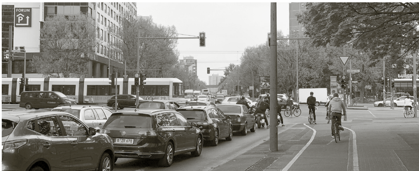
Schon jetzt staubelastet: Storkower Straße / Landsberger Allee.