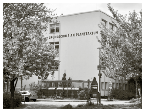
Grundschule am Planetarium

Die Verlängerung dieser Sperre wurde in der BVV jedoch von einer Mehrheit aus Grünen, CDU, FDP und AfD – ohne eine Be-