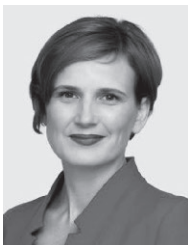
Katja Kipping Senatorin für Integration, Arbeit und Soziales

sich von dem Dogma verabschieden, Millionäre vor höheren Steuern schützen zu wollen.