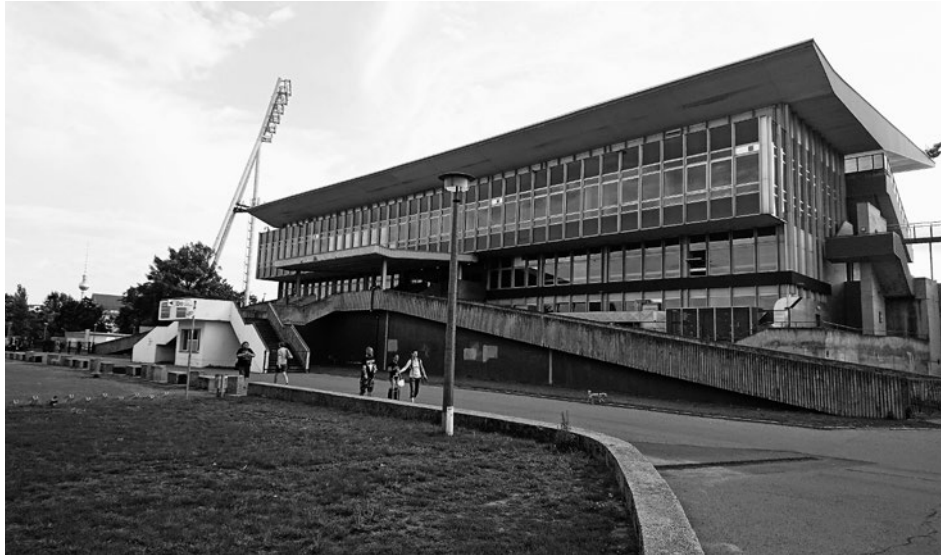
Markant: Das Tribünengebäude und die Flutlichtmasten des Jahnstadions

Die Senatsverwaltungen für Sport und für Stadtentwicklung haben sich auf einen Neubau statt auf einen Umbau des Stadions festgelegt. Das wirft Klimaschutzfragen auf. Zudem soll das neue Stadion zwar in die bisherigen Stadionwälle eingepasst werden. Ob allerdings die identitätsstiftenden Merkmale wie die Flutlichtmasten und das weithin sichtbare geschwungene Stadionsdach – als Ausdruck der Ostmoderne – erhalten werden, ist nicht gesichert. Zudem können für das Stadion verbindliche Vorschläge eingereicht werden. Die Umgestaltung des Parks hingegen ist nur ein – unverbindlicher – Ideenteil. Zu Recht haben daher Anwohnende die Sorge, dass damit die Planungen für den Park abgehängt werden könnten. Zumal bislang nur Geld eingestellt ist, um das Stadion abzureißen und neu zu bauen.