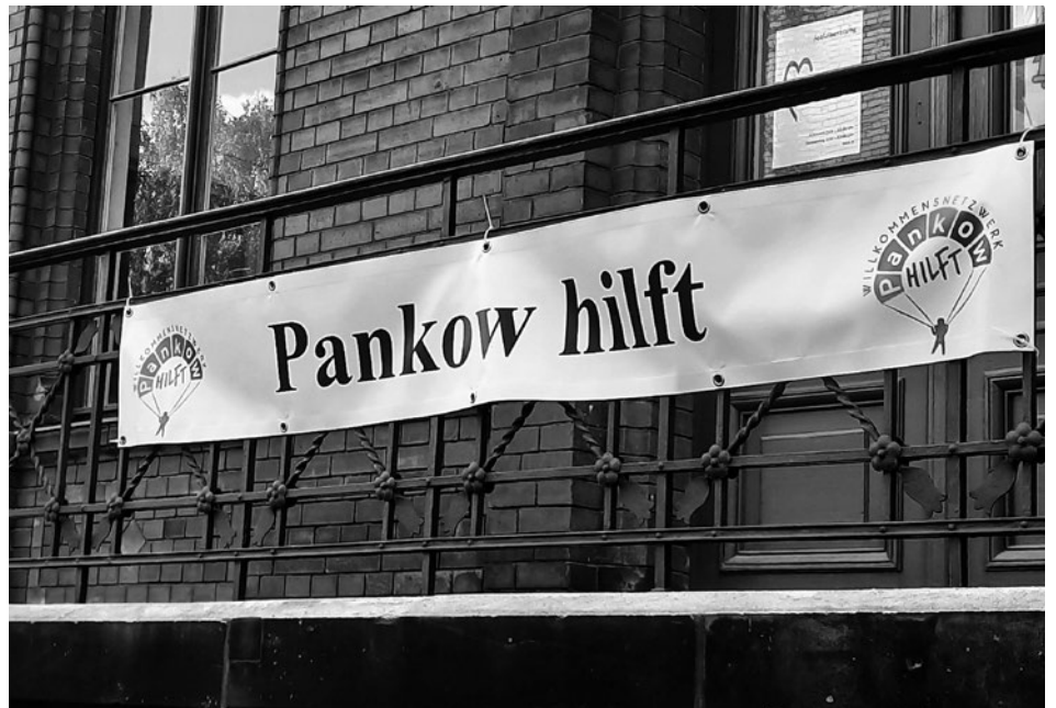
Bezirksamt Pankow in der Fröbelstraße 17

Auch die Bürgermeisterin unserer polnischer Partnerstadt Kolobrzeg hat um Hilfe für die Versorgung von Geflüchteten in ihrer Stadt gebeten. Das Bezirksamt organisiert nun, gemeinsam mit Vereinen und Ehrenamtlichen aus der Zivilgesellschaft, Transporte von benötigten Materialien.