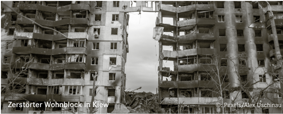
Zerstörter Wohnblock in Kiew