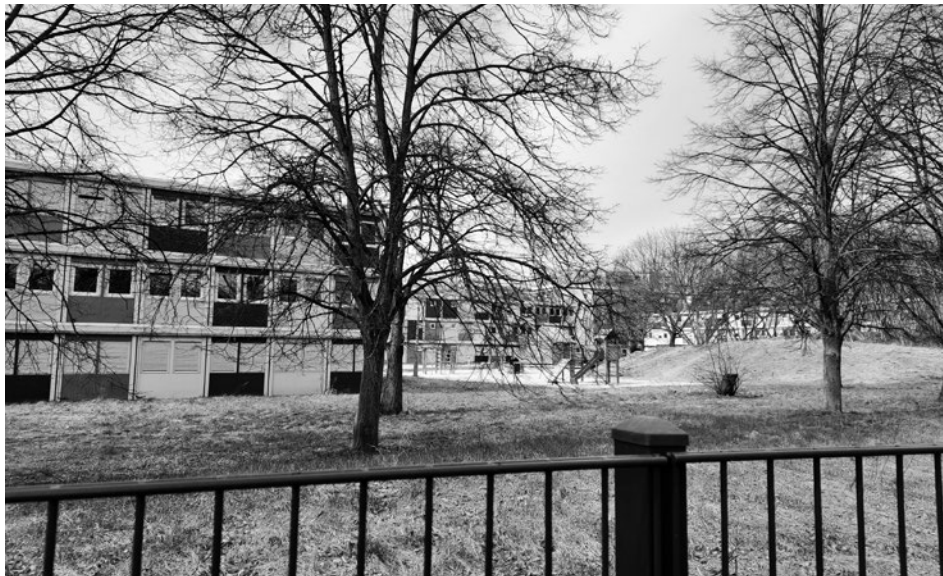
Das ehemalige Refugium in Buch: Sicherer Hafen für Geflüchtete

kamen in der ersten Wochen nach Berlin. Heute sind es weniger, weil die Verteilung zwischen den Bundesländern besser