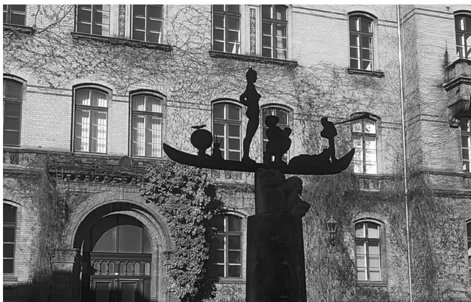
Anlaufpunkt für Flüchtlinge aus der Ukraine: Das Bürgeramt in der Fröbelstraße

BVV Pankow hatte jedoch bereits mehrfach beschlossen, dass dort eine der vielen, dringend benötigten Schulen entstehen soll. Auf Antrag der Linksfraktion, dem sich SPD und Grüne angeschlossen haben, wird das Bezirksamt nun aufge-