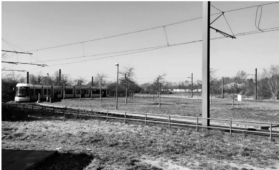
Wendeschleife der Straßenbahn an der Elisabeth-Aue

Der neue rot-grün-rote Koalitionsvertrag sieht nunmehr die Elisabeth-Aue als Wohnbaustandort vor. Gleichwohl sind keine Wohnungsbauzielzahlen genannt.