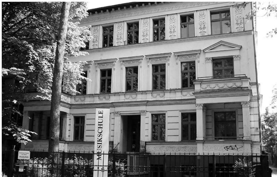
Erfolgsprojekt: Musikschule Béla Bartók am Schloßpark in Pankow

Musikschule, für die Ausstattung von Grundschulen, für Spielplätze und Gehwegsanierungen erhöht. Zudem soll mit einem digitalen Projekt die Information und Beteiligung von Bürger*innen gestärkt werden.