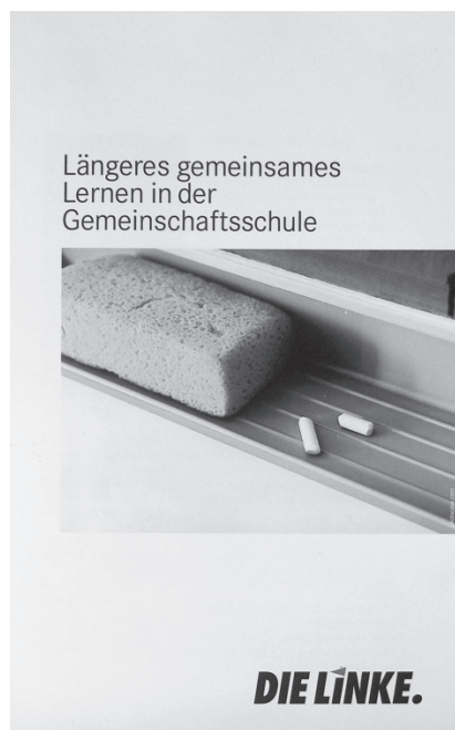
Längeres gemeinsames Lernen in der Gemeinschaftsschule

Vielmehr könne individuelle Förderung auch in den bestehenden Schularten durch eine neue Lehr- und Lernkultur verwirklicht